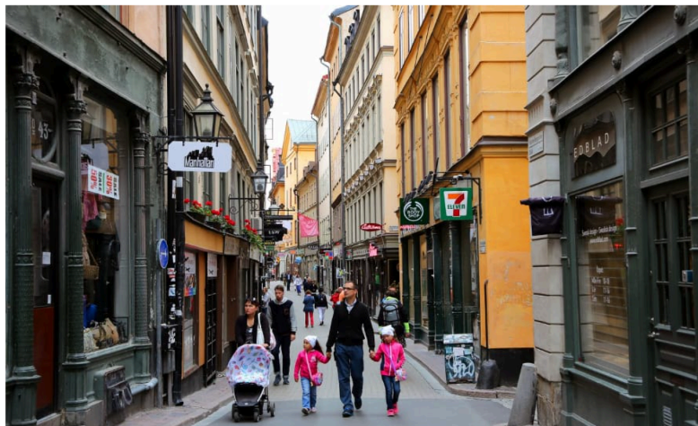
■ Västerlånggatan i Gamla stan i hör till de mest populära stråken bland turister i Stockholm.

– Det är en bra fråga. Jag skulle inte bestrida om någon säger att grundorsaken är en oro över den amerikanska utvecklingen snarare